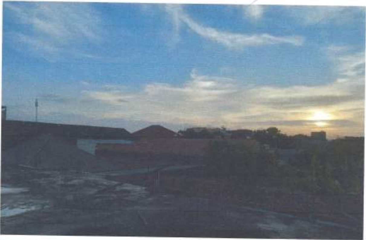
Foto Atap Gedung